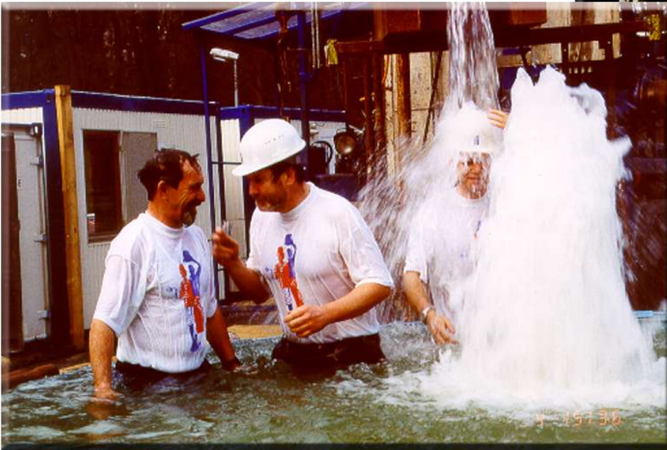
Das Thermalwasser ist erschlossen