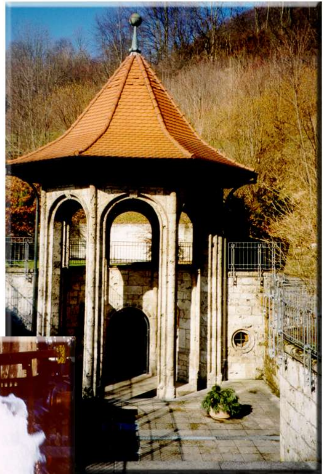
Quelltempel für einen Säuerling