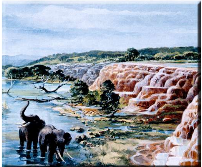
Travertinstehung aus Mineralwasser (Reiff 1998)