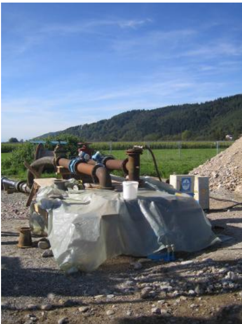
Versuchsaufbau während eines Pumpversuchs zur Bestimmung von Aquiferkennwerten

Die Abflussrate und die Fließgeschwindigkeit im Aquifer werden zusätzlich durch den hydraulischen Gradienten (Grundwassergefälle) bestimmt.