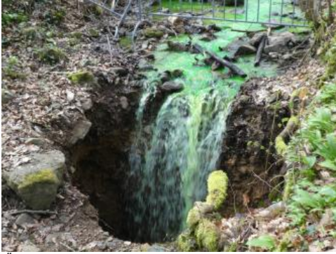
Übertritt des mit Uranin markierten Wassers in einen Erdfall

Im Oberjura der Schwäbischen Alb wurden mehrere Hundert Markierungsversuche durchgeführt, die meisten im Zeitraum 1955 bis 1970. Die große Anzahl an Versuchen ist in der Verkarstung des Oberjura-Karstgrundwasserleiters begründet. Die hohen Fließgeschwindigkeiten in den Karststrukturen erlauben die Durchführung dieser Versuche trotz großer Einzugsgebiete in einem vertretbaren Zeitraum. Bei rund 90 % der Versuche erfolgte die Eingabe des Tracers an der Erdoberfläche. Oft wurden hierfür Dolinen genutzt, in anderen Fällen waren es Trockentäler mit Sickerstellen, Karstspalten, Schürfruben oder flache Bohrlöcher. Daneben erfolgten Farbeingaben auch in Kläranlagenausläufen, die in Dolinen versickerten oder kleinen, über dem Grundwasser schwebenden Oberflächengewässern mit Versickerungsstellen. Eine Farbeingabe erfolgte direkt im Blautopf-Höhlsystem (Lauber et al., 2013a; Lauber