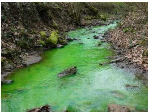
Mit dem Markierungsstoff Uranin eingefärbtes Oberflächengewässer

Für die Erkundung der Grundwasserverhältnisse auf der Schwäbischen Alb sind Markierungsversuche von besonderer Bedeutung. Sie dienen dazu, wichtige Erkenntnisse über die Fließrichtung und Fließgeschwindigkeit des Wassers im Untergrund zu gewinnen.