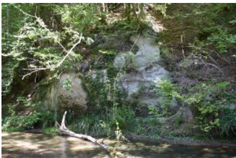
Prallhang aus Sandstein der Oberen Meeresmolasse im Aachtobel bei Überlingen-Lippertsreute

Das im Linzgau gelegene Flüsschen Aach (auch Linzer Aach) hat sich nach dem Abschmelzen der Gletscher am Ende der letzten Kaltzeit seinen Weg nach Süden ins Bodenseebecken gesucht und sich dabei zwischen Herdwangen-Schönach-Großschönach und Frickingen-Bruckfelden 80–120 m tief in die weichen Molassegesteine eingeschnitten. Besonders im unteren Talabschnitt zwischen Owingen-Hohenbodman und den zu Überlingen-Lippertsreute gehörenden Steinhöfen ist dabei ein imposanter rund 2 km langer schluchtartiger Talabschnitt entstanden. Ungefähr 200 m westlich der Steinhöfe sind am nördlichen Prallhang oberhalb einer flachen Halde bis zu 12 m mächtige Sandsteinschichten der tertiären Oberen Meeresmolasse aufgeschlossen. In diese weichen Sandsteine wurden Keller, Grotten sowie die Wallfahrtskapelle „Maria im Stein“ gegraben.