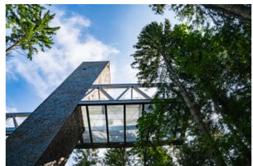
Aussichtsturm im Nationalparkzentrum Schwarzwald; Foto: Daniel Müller (Nationalpark Schwarzwald)

Der in 900 m Höhe liegende moderne Bau fügt sich so harmonisch in den umgebenden Wald ein, als hätte er schon immer hier gestanden. Mit den langen, übereinander liegenden Riegeln, die an bei einem Sturm umgeworfene Baumstämme erinnern, bringt das Nationalparkzentrum Ruhestein auch sein Inneres schon nach Außen. Vom 34 m hohen Aussichtsturm können die Gäste den Ausblick in den an dieser Stelle etwa 120 Jahre alten Tannen- und Fichtenwald genießen.