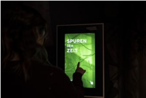
In der interaktiven Ausstellung im Nationalparkzentrum Schwarzwald

Mit der neuen, interaktiven Ausstellung zum wilder werdenden Wald, einem Kino, der Brücke der Wildnis, einem Shop und einem Café ist das neue Nationalparkzentrum ein spannendes Tagesziel inmitten der wunderschönen Natur des Nordschwarzwalds – auch bei schlechtem Wetter. Der Ort ist auch der ideale Startpunkt für eine erste Erkundung des Nationalparks. Die Mitarbeiterinnen und Mitarbeiter stehen dort für alle Fragen zum Schutzgebiet und für Tourentipps gerne zur Verfügung. Am Ruhestein haben zudem viele Veranstaltungen und Führungen ihren Ausgangspunkt, an denen man nach vorheriger Online-Anmeldung teilnehmen kann.