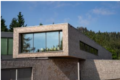
Nationalparkzentrum Schwarzwald

Die besondere Natur im Nationalpark Schwarzwald ist auch eng mit dem geologischen Untergrund und der Landschaftsgeschichte verknüpft. Zu entdecken gibt es Kare, Grinden, Missen und Moore sowie die Blockhalden und Felsen des Buntsandstein-Schwarzwalds. Viel Wissenswertes zu dem Gebiet erfährt man in dem am 16. Oktober 2020 offiziell durch Ministerpräsident Kretschmann eröffneten Nationalparkzentrum auf dem Ruhestein.