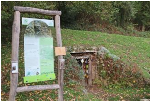
Stollenmundloch am Eingang des Silberbergwerks Grube Erich bei Waldkirch-Suggental

Der Bergbauwanderweg Silbersteig bei Waldkirch-Suggental im Mittleren Schwarzwald erschließt in zwei unterschiedlich langen Varianten das Tal und die Spuren des ehemaligen Bergbaus, der seit dem Mittelalter im Suggental umging. Entlang des Wegs wurden an Aussichtspunkten oder wichtigen Bergbaubefunden ausführliche Informationstafeln angebracht, die Wissenswertes zum Suggental und dem früheren Bergbau vermitteln. Bedeutende Punkte entlang der Strecken sind beispielsweise das Besucherbergwerk Grube Erich, der Urgraben, die alte Friedhofskapelle beim Bürlidamshof sowie die Aussichtspunkte auf dem Luser und am Wissereck. Die Wegstrecken betragen ca. 6 km und 12 km.