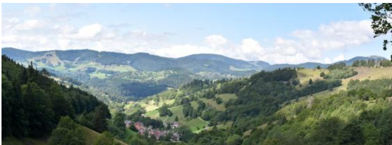
Panoramablick über Tunau nach Westen ins Wiesetal bei Schöna u und ganz rechts nach Nordwesten zum Belchen

belchen.de/de/prospekte erhältlich. Sie enthält anschauliche Grafiken und Fotos und gibt zudem auch Auskunft über die erdgeschichtliche Entwicklung der umgebenden Landschaft, die man von mehreren Aussichtspunkten gut überblicken kann (Lehnes & Tochtermann, 2001).