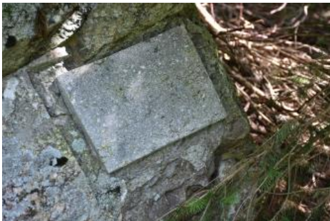
Ganggestein an Station 8 am Pfad ins Erdaltertum bei Tunau

Die Umgebung der kleinen Gemeinde Tunau bei Schöna u im südlichen Schwarzwald liegt im Bereich einer geologischen Nahtstelle, der sog. Badenweiler–Lenzkirch-Zone. Es handelt sich um einen 2–5 km schmalen, quer durch den Südschwarzwald verlaufenden Streifen, in dem an einer alten Plattengrenze schwach umgewandelte Sedimentgesteine und Vulkanite aus dem Erdaltertum (Unterkarbon) vorkommen (Sawatzki & Hann, 2003). Der Pfad ins Erdaltertum erklärt an mehreren Stationen die Gesteine, die bei der damaligen Kollision zweier Kontinentalplatten entstanden sind. Die Felsblöcke sind auf einer kleinen Fläche angeschliffen, so dass die Mineralkörner gut zu erkennen sind. Die einzelnen Stationen sind allerdings nur durch Nummern gekennzeichnet. Eine ausführliche Broschüre dazu ist bei der Touristeninformation in Schöna u oder bei schwarzwaldregion-