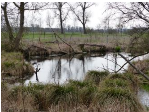
Quelltopf Grimmensee östlich von Langenau

Im Donautal nordöstlich von Ulm liegt der Grimmensee. Der Karstquelltopf befindet sich am Rand eines Wäldchens ca. 3500 m östlich von Langenau, westlich der See- und Ölmühle. Von einer Schülergruppe des Robert-Bosch-Gymnasiums Langenau unter der fachlichen Leitung von G. Krämer wurde hier ein kurzer Lehrpfad ausgearbeitet. Auf vier Informationstafeln werden geologische und hydrologische Zusammenhänge erklärt und Verkarstung, Karstformen und bodenkundliche sowie geologische Profile zum Thema gemacht.