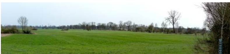
Im Langenauer Ried

bis in die Gegend von Langenau, wo es in Karstaufbrüchen und Quelltöpfen wie dem Grimmensee oder der Nauquelle wieder austritt. Die Oberjura-Gesteine sind auf der Flächenalb zwischen dem Lonetal und Langenau teilweise von gering durchlässiger, tertiärer Molasse und quartärem Lösslehm überdeckt, wodurch das Grundwasser besser vor Verunreinigungen geschützt ist. Der Zufluss des Karstwassers in das Donautal hat zu einer großflächigen Moorbildung beigetragen. Die Niedermoor torfe des Langenauer Rieds sind häufig mit Lagen aus Wiesenkalk durchsetzt, der aus dem karbonatreichen Wasser von der Schwäbischen Alb ausgefallen ist.