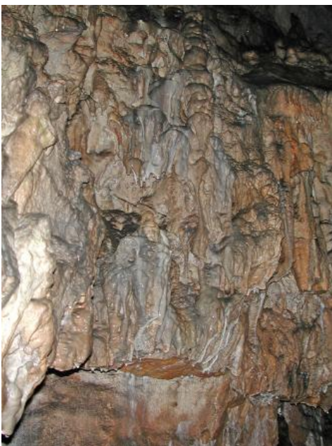
Reich gegliederter Vorhang aus Kalksinter in der Schertelshöhle bei Westerheim

Seit 2016 gehört die Schertelshöhle zu den Geopoints des Geoparks Schwäbische Alb. Die Besucherhöhle ist außerdem Teil des Netzwerks „Informationszentren im Biosphärengebiet Schwäbische Alb“ und eine von 15 Anlaufstellen der „Partner des Biosphärengebiets“. Nur je etwa 200 m entfernt liegt auf der anderen Talseite das Steinerner Haus und nördlich davon die Ruine der Burkhardtshöhle.