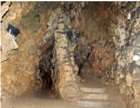
In der Schertelshöhle bei Westerheim

Die Schertelshöhle befindet sich auf der Schwäbischen Alb, im vorspringenden rechten Talhang eines Trockentals, das zum Filstal führt, ca. 3,5 km nordwestlich von Westerheim. Sie ist in Kalksteinen des Oberjuras als Flusshöhle entstanden, weist einen L-förmigen Verlauf auf und wird im Knick durch einen künstlichen Eingangsstollen betreten. Die Gesamtlänge beträgt ca. 212 m, geführt wird der Besucher durch 160 m. Die Höhle ist sehr reich an Klüften, malerischen Tropfsteinen und Sinterfahnen. Im tiefsten Teil der Höhle trifft man auf eine bis 15 m hohe Halle mit viel Sinterschmuck (Binder & Jantschke, 2003).