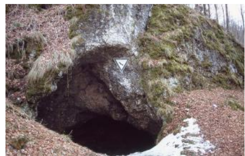
Das Steinerner Haus auf der Mittleren Kuppenalb bei Westerheim

Seit 2016 gehört die Schertelshöhle zu den Geopoints des Geoparks Schwäbische Alb. Die Besucherhöhle ist außerdem Teil des Netzwerks „Informationszentren im Biosphärengebiet Schwäbische Alb“ und eine von 15 Anlaufstellen der „Partner des Biosphärengebiets“. Nur je etwa 200 m entfernt liegt auf der anderen Talseite das Steinerner Haus und nördlich davon die Ruine der Burkhardtshöhle.