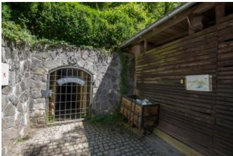
Eingangsbereich des Besucherbergwerks Grube Wenzel bei Oberwolfach

Der Bergbau im Wolfacher Bergbaurevier im Mittleren Schwarzwald hat eine Tradition, die weit in das Mittelalter zurückreicht. Die Grube Wenzel wurde schon vor 1700 erschlossen. Die Hochphase des Bergbaus mit einer ertragreichen Silbererzförderung war zwischen 1760 und 1823. Insgesamt wurden in diesem Zeitraum aus den Erzen der Grube rund 4 t Silber, 400 kg Kupfer und 850 kg bleihaltige Produkte gewonnen. In einem steil stehenden Baryt-Calcit-Gang, dem Wenzelgang, finden sich neben Schwespat, Calcit und Quarz u. a. Silber-Antimonerze, Eisenkarbonate, Fahlerz, Kobalt- und Nickelerze. Beim umgebenden Gestein handelt es sich um Paragneis, der von Granit- und Pegmatitgängen durchzogen ist (Werner & Dennert, 2004).