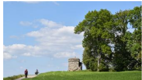
Die Königskanzel bei Dornstetten

Die Königskanzel liegt am Ostrand des Freudenstädter Grabens. Die nordöstliche Verwerfungslinie des Grabens zwischen Dornstetten-Hallwangen und Schopfloch bewirkt einen vertikalen Gesteinsversatz von ca. 100 m. Die Folge davon ist, dass östlich von Dornstetten Oberer Muschelkalk und Oberer Buntsandstein fast im selben Niveau nebeneinander liegen und dass die Muschelkalk-Gäulandschaft weit nach Westen in den Schwarzwald, bis an den Stadtrand von Freudenstadt vorspringt. Der Freudenstädter Graben ist ähnlich wie der Fildergraben ein NW-SO-verlaufendes Strukturelement, das quer zum sog. Schwäbischen Lineament verläuft, einer bedeutenden Störungszone, die sich vom Schwarzwald bis zum Nördlinger Ries durch das ganze Land erstreckt.