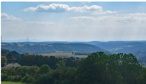
Muschelkalk-Gäulflächen und Glatttal bei Dornstetten

Das Gebiet ist vom Oberlauf der Glatt und ihren Nebenbächen zerschnitten. Das Muschelkalk-Hügelland wird in weiten Bereichen landwirtschaftlich genutzt. Die höher gelegene Buntsandstein-Landschaft im Hintergrund ist dagegen geschlossen bewaldet. Im Südosten reicht der Blick bei klarer Sicht bis zur Schwäbischen Alb und im Nordwesten bis zur Hornisgrinde.