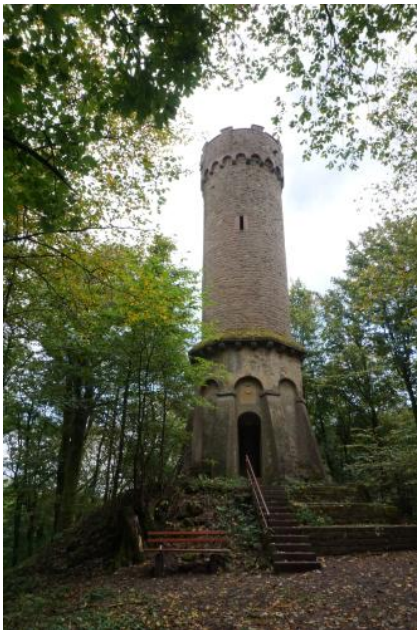
Aussichtsturm auf dem Katzenbuckel

Auf der 626 m ü. NHN hohen Bergkuppe des Katzenbuckels befindet sich ein 18 m hoher, historischer Aussichtsturm aus Buntsandstein. Er wurde bereits 1820 erbaut und bietet einen herrlichen Rundblick in das Ittertal, hinüber zu Taunus, Spessart, Bauland und Kraichgau sowie in das Neckartal. In der näheren Umgebung blickt man auf die vom Oberen Buntsandstein gebildete Hochflächenlandschaft des Hinteren Odenwalds bei Waldbrunn. Der Katzenbuckel ist der höchste Berg des Odenwalds. Er ist der Rest eines kreidezeitlichen Vulkanschlots, der als Härtling der Abtragung im Laufe der Jahrmillionen mehr Widerstand entgegengesetzt hat, als die umgebenden Gesteine. Zum Gipfel führt ein Lehrpfad (Weg der Kristalle), der den Vulkanismus und die Landschaftsentwicklung am Katzenbuckel erklärt.