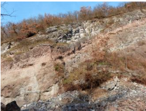
Aufgelassener Steinbruch am Büchsenberg bei Vogtsburg im Kaiserstuhl

vor allem Pyrochlor, Perowskit, Magnetit und Phlogopit. Seine Entstehung wird auf den Aufstieg hochgradig differenzierter Restschmelzen gegen Ende des Kaiserstuhl-Vulkanismus zurückgeführt. Die genannten Gesteine sind alle subvulkanische Bildungen, die aus bereits im Untergrund erstarrtem Magma und nicht bei einem Ausbruch an der Oberfläche entstanden sind. Auf sehr kleinen Flächen finden sich auch subvulkanische Brekzien. Nördlich der Eichelspitze wurden die alttertiären Mergelsteine und kalkigen Sandsteine in der Kontaktzone zu den aufgedrungenen Vulkaniten schwach metamorph überprägt und dabei gehärtet.