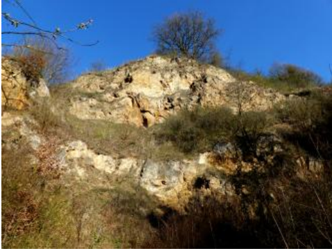
Aufgelassener Steinbruch im Badloch mit Thermalquelle, Vogtsburg im Kaiserstuhl

Im Zentrum des Kaiserstuhls mit dem Hauptkamm nehmen Essexite und Theralite in einer gemeinsamen geologischen Einheit die größten Flächen ein. Auf der Ostseite des Hauptkamms mit der Eichelspitze und dem östlich davon gelegenen Bötzingen Fohberg sind Phonolithe und porphyrische Ganggesteine verbreitet. Der Phonolith ist u. a. wegen seines Gehalts an Zeolithen ein vielseitig verwendbarer Rohstoff. Der Mondhaldeit wurde zuerst am Kaiserstuhl beschrieben. Außer an der Mondhalde bei Oberrotweil kommt er kleinflächig bei Schelingen und am Ihringer Winklerberg vor. Er ist ein graues bis hellgraues, feinkörniges Ganggestein mit einer Grundmasse aus Alkalifeldspat und Plagioklas mit kleinen Einsprenglingen (Augit) und häufig eingeregelter Blasen. Am Badberg und Haselschacher Buck liegen die größten Vorkommen vom seltenen Karbonatit. Er besteht zu 90 % aus mittel- bis grobkristallinem Calcit. Seine Nebenminerale sind