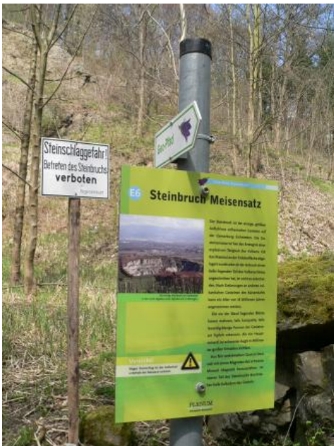
Informationstafel am Geopfad Eichstetten

Weiterführende Informationen finden sich bei Wimmenauer (2003, 2009b), Groschopf & Villinger (2009), Geyer (2019d, 2019f), Huth (2019c), Huth & Treiber (2019a) und Wittenbrink (2019).