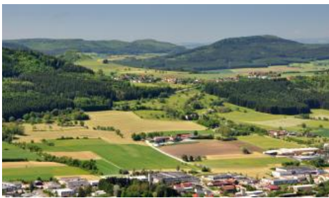
Die Baaralpe-Berge südwestlich von Spaichingen

Der Dreifaltigkeitsberg bei Spaichingen bildet einen markanten Vorsprung am Trauf der westlichen Schwäbischen Alb. Der Berg war schon in vorgeschichtlicher Zeit besiedelt und trägt heute eine Wallfahrtskirche. Vom Gipfel hat man einen weitreichenden Ausblick auf das Albvorland, den Albtrauf, die Baar und den Schwarzwald. Bei guter Sicht erkennt man im Süden die Vulkangipfel des Hegaus und die Alpen. Im oberen Bereich finden sich gute Aufschlüsse in den Oberjura-Kalksteinen der Wohlgeschichtete Kalke-Formation (früher Weißjura beta). An den mauerartigen hellen Felswänden ist der Dreifaltigkeitsberg schon von der Ferne zu erkennen. Mittel- und Unterhänge sowie das unmittelbar vorgelagerte Hügelland werden von