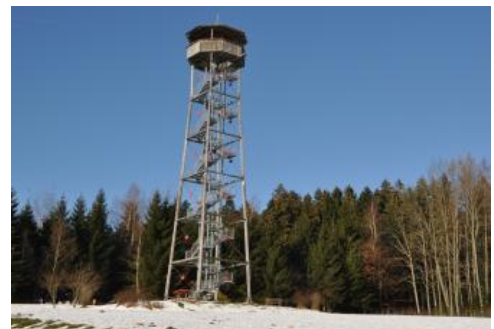
Der Vogteiturm bei Loßburg-Rödt

Die Gemeinde Loßburg hat sich im Dezember 2002 einen besonderen Wunsch erfüllt: Am Waldrand im Ortsteil Rödt konnte in ca. 730 m ü. NHN ein neuer Aussichtsturm eingeweiht werden. Aus Stahl und Douglasienholz wurde ein 35 m hoher Turm erstellt, dessen Aussichtsplattform in 31 m Höhe angebracht ist. Von dort genießt man bei klarem Wetter eine Fernsicht über die Oberen Gäue bis in den Raum Stuttgart, zum Trauf der westlichen Schwäbischen Alb sowie über die Höhen des umgebenden nördlichen und mittleren Schwarzwalds.