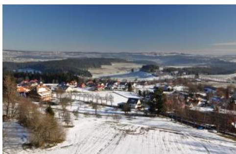
Nach Nordosten blickt man vom Vogteiturm über das Muschelkalk-Gebiet des Freudenstädter Grabens bis nach Dornstetten und Schopfloch

Loßburg liegt am südlichen Rand des Freudenstädter Grabens, einer tektonischen Struktur, in der die Gesteine des Muschelkalks und damit die Oberen Gäue weit nach Westen reichen. Vom Vogteiturm aus lässt sich der Gegensatz zwischen dem bewaldeten Buntsandstein-Schwarzwald und der offeneren Gäulandschaft gut erkennen.