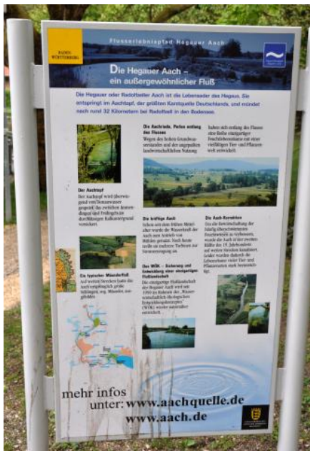
Flusserlebnispfad Hegauer Aach – Informationstafel am Aachtopf

Die Hegauer oder Radolfzeller Aach entspringt dem Aachtopf, der größten Karstquelle Deutschlands, und mündet nach nur 32 km bei Radolfzell in den Bodensee. Interessant ist, dass die Aach zwei Drittel ihrer gesamten Wasserführung aus der Donau bezieht, deren Wasser zwischen Immendingen und Fridingen in den verkarsteten Hohlräumen des Oberjura versickert und nach ca. 12 km unterirdischem Lauf (Luftlinie) am Aachtopf wieder austritt (Donauversinkung und Aachtopf).