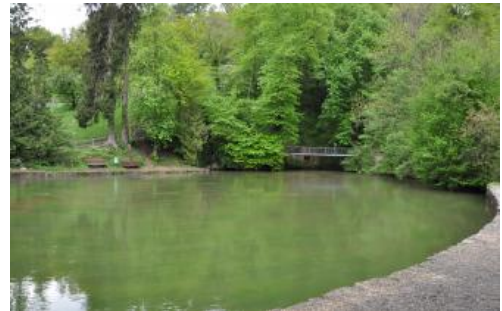
Der Aachtopf bei Aach ist die am stärksten schüttende Karstquelle Deutschlands