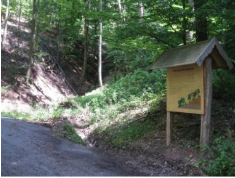
Geographischer Lehrpfad Schwäblesklinge; Foto: J. Eberle

Der Lehrpfad ist mit öffentlichen Verkehrsmitteln optimal erreichbar. Auch wegen fehlender Parkmöglichkeiten ist eine Anreise mit dem eigenen Fahrzeug daher nicht zu empfehlen. Der rund 3 km lange Weg mit ca. 150 m Höhenunterschied kann in 1 bis 1,5 Stunden erwandert werden. Näheres zu Lage, Ausgangs- und Endpunkt des Lehrpfads sind dem zugehörigen Faltblatt zu entnehmen (s. u.).