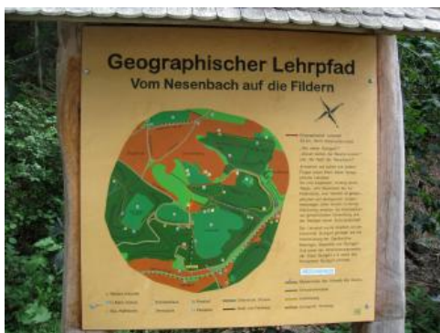
Übersichtstafel am Lehrpfad Schwäblesklinge