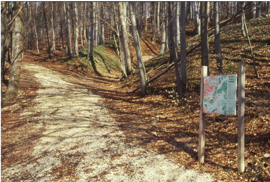
Bergbaupfad bei Aalen-Wasseralfingen

Erzabbau und Eisenverhüttung haben im Raum Aalen eine Jahrhunderte lange Tradition. Um diese lebendig zu halten nachdem die Hochöfen erkalten sind und der Bergbau erloschen ist, wurde dieser Bergbaupfad geschaffen. Er beginnt beim Besucherbergwerk Tiefer Stollen. Auf dem abwechslungsreichen Rundweg wird an insgesamt 23 Info-Stationen auf ansprechenden Übersichts-, Lehr- und Objekttafeln die Geschichte des damaligen Bergbaus erläutert. Abgebaut wurden früher die eisenhaltigen Flöze in der Eisensandstein-Formation (Mitteljura).