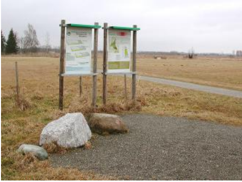
Archäologischer Moorlehrpfad in Bad Buchau

Rund um den Federsee zeigen sich in beispielhafter Weise die Verlandungsstadien eines übertieften Gletscherzungenbeckens von den randlichen Seeterrassen über Moorbildungen bis hin zum breiten Schilfgürtel um die offene Seefläche. Das Federseemoor ist nicht nur ein moorgesichtlich bedeutendes Forschungsgebiet, auch Botaniker kommen voll auf ihre Kosten. Ornithologen können im Federseegebiet über 256 Vogelarten beobachten, davon über 100 Arten als Brutvögel. Das Federseemoor war schon seit der Frühgeschichte intensiv besiedelt. Die Ausgrabungen von jungsteinzeitlichen und bronzezeitlichen Pfahlbausiedlungen bei Bad Buchau, Oggelshausen und Seekirch erbrachten für diese Zeit die bedeutendsten wissenschaftlichen Erkenntnisse in Europa. Im Federseemoor liegen deshalb vier Fundstellen des seit 2011 von der UNESCO anerkannten