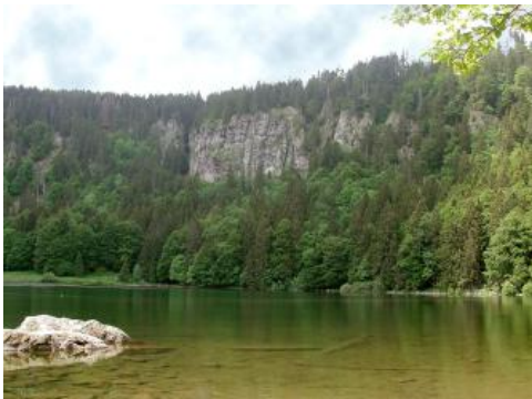
Der Feldsee mit der steilen Karwand

Das Feldseekar ist wohl das bekannteste und schönste seiner Art im südlichen Schwarzwald. Die „Lehnstuhlform“ ist mit sehr steilen felsigen Wänden typisch ausgebildet. Das Feldseekar wurde wohl bereits in der vorletzten Eiszeit (Riß) angelegt. Seine heutige Ausformung erhielt es während der letzten Eiszeit (Würm) durch den Feldberggletscher. Hinter dem Feldsee erhebt sich die beeindruckende, steile Karwand über 300 m hoch bis knapp unter den Feldberggipfel. Die Felswand besteht aus Migmatiten (durch teilweise Aufschmelzung umgewandelter Paragneis). Im oberen Teil der Wand finden sich harte Quarzporphyre. Die Karsenke ist durch die Gletschererosion stark übertieft und wird vom Feldsee eingenommen. Der See ist maximal 32,5 m tief, sehr kalt und beherbergt eine interessante Flora. Er wird im Osten von zwei Endmoränenwällen abgeriegelt. Der innere, steilgeböschte Wall wird aufgrund von Tuff-Funden im Moor zwischen