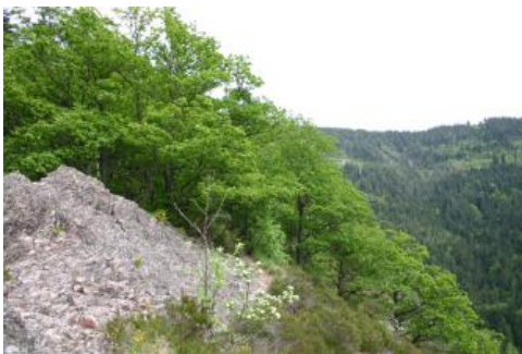
Der Karlsruher Grat mit Felsen, Heidekraut und Traubeneichenwald

Den warm-trockenen Bereich der Felsen und Schutthalden am Südhang des Karlsruher Grats besiedeln z. B. Felsenbirne, Mehlbeere, Heidekraut, Behaarter Ginster und Flechten. Als Wälder sind lichte Bestände vorwiegend aus Eichen, Kiefern und Esskastanien entwickelt. Teilweise handelt es sich um durchgewachsene Traubeneichenschälwälder, die früher der Gewinnung von Rinde für Gerbereien dienten. Auf Standorten mit tiefgründigen Böden finden sich Mischwälder aus Fichten, Tannen, Douglasien, Buchen und Bergahorn. Im feuchten Bereich um die Wasserfälle sind Farne und Moose zahlreich vertreten. Auf den Granithängen kommen noch Berg-Glatthaferwiesen dazu. Entsprechend vielfältig ist auch die Tierwelt mit Insekten, Amphibien, Fledermäusen und Vögeln wie dem Kolkraben.