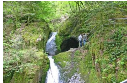
Wasserfall des Gottschlägbachs mit dem Edelfrauengrab

Der Gottschlägbach hat ein tiefes Kerbtal in die Vulkanite gegraben, das auf knapp 2 km, von den Quellbächen unter dem Vogelskopf (in ca. 910 m ü. NHN) bis zum großen Porphyrssteinbruch im Ortsteil Ottenhöfen-Edelfrauengrab, einen Höhenunterschied von über 500 m überwindet. Das Quellgebiet reicht im Bereich einer Verwerfung noch in die Eck-Formation des Unteren Buntsandsteins hinein. Im südlichen Talzweig liegen mehrere Quellen an der Grenze zwischen Quarzporphyr und Tigersandstein-Formation (Zechstein). Der gegenüber dem Quarzporphyr weniger harte Seebach-Granit steht im oberen Teil des Tals auf der südlichen Talseite an. Die Hangneigung ist hier meist geringer, sodass sich ein auffällig asymmetrischer Talquerschnitt ergibt. Die Falkenschrofen mit zwei hohen Felstürmen bilden im Granit die einzigen Festgesteinsaufragungen. Unterhalb durchschneidet der Gottschlägbach den harten Quarzporphyr in einer engen Schlucht. Der Bach fällt hier in zahlreichen, bis 8 m hohen Wasserfällen über annähernd 100 Höhenmeter ab. Einer dieser Wasserfälle befindet sich beim „Deglerbad“, wo der Gottschlägbach über eine Gefällstufe mit steil stehender, plattiger Absonderung der Quarzporphyre in einen breiten Kessel fällt. Eine weitere bekannte Gefällestufe folgt talabwärts beim „Edelfrauengrab“ mit seiner ausgekolkten Höhle. Mit dem Steinbruch endet dann das Quarzporphyr-Vorkommen.