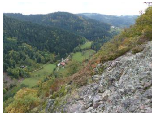
Gottschlägtal und Karlsruher Grat bei Ottenhöfen im Schwarzwald

Das Gottschläggebiet besteht überwiegend aus Quarzporphyr (Rhyolith), der zu Beginn des Perms vor etwa 296 bis 302 Mio. Jahren entstand (Grünberg-Quarzporphyr). Während des Rotliegend wurde damals saures vulkanisches Magma gefördert, das als Tuff, Ignimbrit oder Deckenerguss zum Ausbruch kam. Die zerklüftete Felspartie des Karlsruher Grats stellt den Rest einer gewaltigen Spalteneruption dar, die auf über 4 km Länge und bis 750 m Breite mächtige Ergussmassen hinterlassen hat. Es ist eine urtümliche und bizarre Landschaft, die nach Norden etwa 90 m und nach Süden ca. 180 m tief abfällt. Der riffartige Kamm des Karlsruher Grats mit seinen schroffen Steilabfällen hebt sich deutlich von den abgerundeten Berghängen, Rücken und Kuppen des benachbarten Granitgebiets ab.