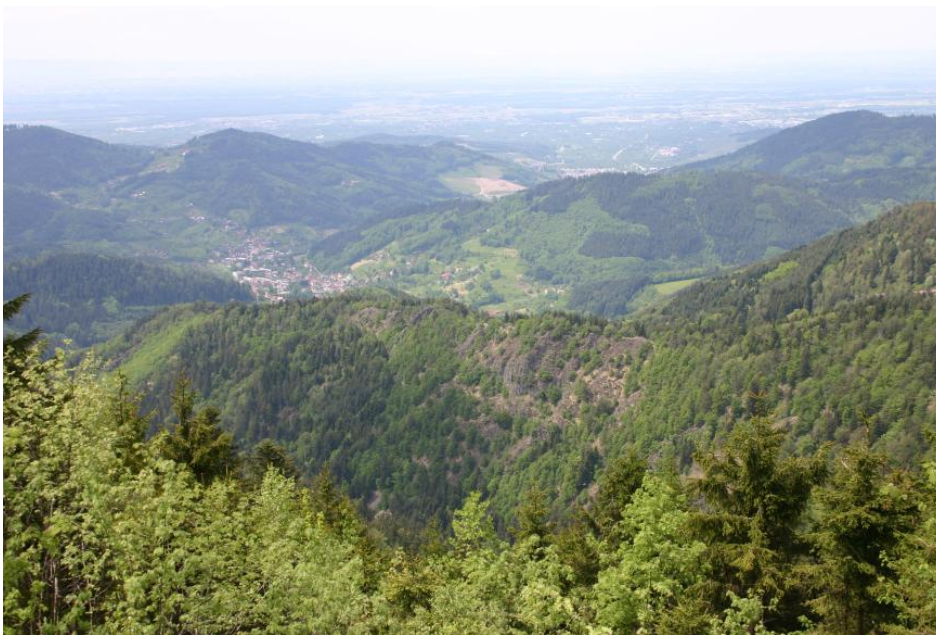
Blick auf den Karlsruher Grat und den Grundgebirgs-Schwarzwald mit dem Achertal

Das Gottschlätgal liegt im stark zertalten, nach Westen zum Oberrheingraben hin ausgerichteten Teil des Nordschwarzwalds. Es zweigt bei Ottenhöfen in südlicher Richtung vom Achertal ab und wendet sich dann nach Osten. An der Nordflanke des Gottschlätgals ragt steil der Karlsruher Grat auf, der auch Eichhaldenfirst genannt wird. Im Osten endet das Tal vor dem Anstieg zur Buntsandstein-Schichtstufe am Melkereikopf und Vogelkopf. Das Gebiet steht auf 154 ha unter Naturschutz. Eine Wanderung durch die Schlucht des Gottschlätgabs über den Karlsruher Grat gehört wohl zu den eindrucksvollsten Touren im Nordschwarzwald.