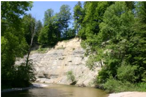
Prallhang der Unteren Argen nordwestlich von Isny im Allgäu-Neutrauchburg

Der Prallhang der Unteren Argen liegt im Allgäu, nordwestlich von Isny-Neutrauchburg. Er zeigt eine rund 20 m hohe Abfolge von Sedimenten der Oberen Süßwassermolasse, welche für die Randbereiche des Adelegg-Berglands typisch ist. Während in der Adelegg vor allem verfestigte Konglomerate (Nagelfluh) dominieren, unterbrochen von nur geringmächtigen sandigen und mergeligen Lagen, werden die Sedimente zum Randbereich hin deutlich feinkörniger. Aufgeschlossen sind hier fluviatile Konglomerate, dann Sandstein und vor allem sandige Mergelsteine, in die sich die Argen relativ leicht einschneiden konnte. Harte und zu Nagelfluh verbackene Konglomerate der Adelegg sind im Flussbett der Argen als gerundete Grobkiese leicht zu finden und stehen in deutlichem Kontrast zu den eher weichen, mergeligen Gesteinen, die zu quelligen Hängen und Rutschungen neigen.