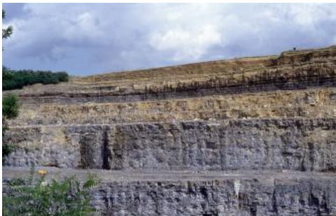
Steinbruch im Schozachtal westlich von Ilsfeld (Lkr. Heilbronn)

Der Steinbruch westlich von Ilsfeld im Schozachtal wurde in den Kalksteinen der Meißner-Formation des Oberen Muschelkalks angelegt und reicht etwa vom Bereich des Tonhorizonts 3 bis hinauf in den Unterkeuper (Erfurt-Formation). Abgebaut werden vor allem die grauen Kalksteine. Darüber folgen gelbliche, dolomitische oder mergelige Fränkische Grenzschichten. Der Unterkeuper muss im Hangenden des Muschelkalks als Abraum beseitigt werden und ist daher immer gut aufgeschlossen. Es handelt sich um eine Abfolge von sehr verschiedenen, durch unterschiedlichste Ablagerungsbedingungen (marin, fluviatil, limnisch sowie terrestrisch, mit allen Übergängen) entstandene Gesteine: Über dem Grenzbonebed, auf Höhe der Abraumsohle, mit Trümmerschutt aus Knochen- und Schalenresten, Zähnen und Schuppen, folgen graue Vitriolschiefer, eine dolomitische