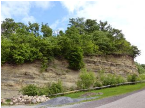
Aufschluss am Horn südlich von Oberderdingen

Das Horn liegt 2 km südlich von Oberderdingen am nordwestlichen Anstieg zum Keuperbergland des Strombergs. Der Aufschluss erschließt auf einer Länge von mehreren Zehner Metern hangaufwärts die gesamte Schichtenfolge der Oberen Grabfeld-Formation (Gipskeuper) bis zur Stuttgart-Formation (Schilfsandstein). Aufgeschlossen sind die Unteren Bunten Estheriensichten und die Grauen Estheriensichten im Hangenden. Darüber folgt die bis 60 cm mächtige Anatina-Bank, hier als dolomitische Steinmergelbank, sowie die Grauen Estheriensichten mit mehreren feinkörnigen Brekzienhorizonten und Steinmergelbänkchen. Schließlich werden die Oberen Bunten Estheriensichten erreicht und das Profil endet mit der Überlagerung durch Sandsteine der Stuttgart-Formation.