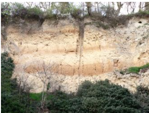
Lösswand hinter der Brauerei von Riegel am Kaiserstuhl

Die ca. 35 m hohe Aufschlusswand hinter der ehemaligen Brauerei von Riegel am Kaiserstuhl zeigt eine mächtige Abfolge mehrerer Lössgenerationen mit deren Bodenbildungen und Überdeckung durch die nächst jüngeren Lössschichten. Jede dieser Schichtfolgen schließt nach oben mit einer Bodenentwicklung (braune Bodenschichten) ab, die nach Entkalkung aus dem primär kalkreichen, hellgelben Rohlöss stattgefunden hat. Der jeweils weggelöste Kalk fiel in Form von Kalkkonkretionen und Lösskindl unterhalb der Paläoböden wieder aus. Die genauen stratigraphischen Abfolgen sind allerdings nicht gesichert, da es immer wieder zu Verschwemmungen, Erosion und Umlagerungen kam. Dies gilt vor allem für die tieferen Lösslagen unter dem dritten braunen Band (von oben). Im Liegenden der Lösswand stehen unter einem roten Band aus pliozänem Lehm verkarstete Kalksteine der Hauptrogenstein-Formation an.