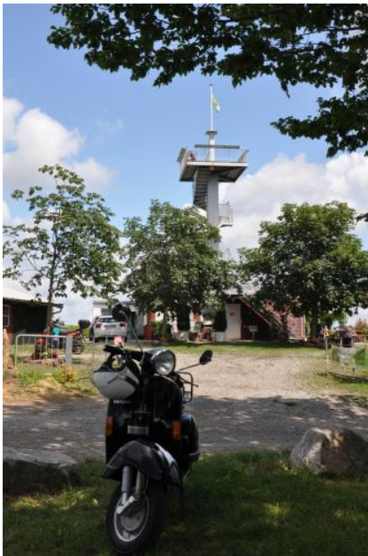
Der Heubergturm bei Ettenheim

Mitten in den Weinbergen südlich von Ettenheim wurde auf 282 m NN der 12,5 m hohe Heubergturm errichtet, der eine schöne Rundumsicht gewährt. Im Westen überblickt man den Süden der Offenburger Rheinebene und schaut bei klarer Sicht bis zu den Vogesen. Im Südwesten ist die Vulkanruine des Kaiserstuhls zu erkennen. Wendet man sich nach Osten, hat man den Mittleren Schwarzwald vor sich, mit dem Ausgang des Ettenbachtals bei Ettenheim-Münchweiler. Während die höheren Berge im Hintergrund von Gesteinen des Grundgebirges, meist Gneisen, gebildet werden, ist das niedrigere bewaldete Bergland davor überwiegend aus Buntsandstein aufgebaut. Es gehört geologisch noch zur Vorbergzone und ist durch die Hauptstrandverwerfung vom Grundgebirgsschwarzwald abgesetzt.