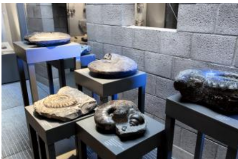
Ammoniten aus dem Unterjura; Foto: Holcim (Süddeutschland) GmbH

In Baden-Württemberg können viele ausschließlich geowissenschaftlich ausgerichtete Museen und Ausstellungen besucht werden. Neben den großen Museen, wie dem Museum am Löwentor in Stuttgart, den Reiss-Engelhorn-Museen in Mannheim und dem Naturhistorischen Museum in Heilbronn sind auch kleinere Museen und Ausstellungen zu nennen. Dazu gehören geologische, mineralogische und paläontologische Sammlungen der Universitäten, wie z. B. in Tübingen oder Heidelberg. Die meisten Museen zeigen überregional zusammengestellte Ausstellungsstücke und bieten ein breites Themenspektrum. Andere konzentrieren sich stärker auf regionale oder thematisch enger begrenzte Schwerpunkte.