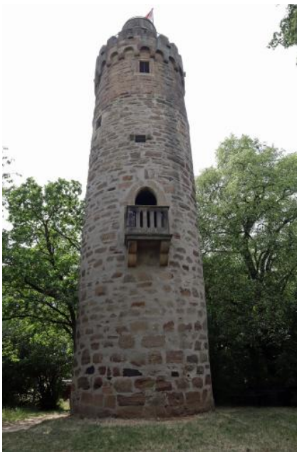
Der Turm auf der Heuchelberger Warte bei Leingarten-Großgartach stammt aus dem 15. Jahrhundert und wurde 1898 wieder hergestellt.

Von den in LGRBwissen vorgestellten Aussichtspunkten ist bei entsprechender Witterung eine gute Fernsicht gegeben. In kurzen Texten wird erläutert, welche Landschaften im näheren und weiteren Umfeld des jeweiligen Aussichtspunkts liegen. Da deren gesamtes Erscheinungsbild, einschließlich Relief, Vegetation und Landnutzung, meist eng mit dem geologischen Untergrund verknüpft ist, bietet die Übersicht einen idealen Einstieg in die Geologie und Landschaftsgeschichte. Über den Landschaftsbezug kann man in LGRBwissen direkt auf Informationen zur Geologie und Landschaftsgeschichte sowie über die Bodenverhältnisse und weitere Themen zugreifen.