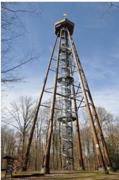
Der Eichbergturm bei Emmendingen

Von den in LGRBwissen vorgestellten Aussichtspunkten ist bei entsprechender Witterung eine gute Fernsicht gegeben. In kurzen Texten wird erläutert, welche Landschaften im näheren und weiteren Umfeld des jeweiligen Aussichtspunkts liegen. Da deren gesamtes Erscheinungsbild, einschließlich Relief, Vegetation und Landnutzung, meist eng mit dem geologischen Untergrund verknüpft ist, bietet die Übersicht einen idealen Einstieg in die Geologie und Landschaftsgeschichte. Über den Landschaftsbezug kann man in LGRBwissen direkt auf Informationen zur Geologie und Landschaftsgeschichte sowie über die Bodenverhältnisse und weitere Themen zugreifen.