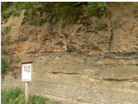
Station am Keuperweg bei Heilbronn

Viele Naturliebhaber sind neben dem reinen Naturerlebnis auch zunehmend an der Entstehung der Landschaft interessiert. Lehrpfade, meist entlang von Wanderwegen, bieten nicht nur Informationen zu Vegetation und Tierwelt, sondern immer häufiger auch zu Geologie und Landschaftsentwicklung.