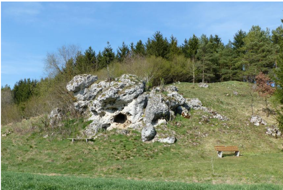
Hohler Stein bei Neresheim-Kösingen

Neben den Besucherhöhlen gibt es im Land zahlreiche weitere Höhlen und Hohlräume, die zwar nicht den Bekanntheitsgrad und die Bedeutung der Besucherhöhlen haben, deren Besuch sich aber dennoch lohnt. Viele dieser Höhlen sind frei zugänglich und ohne Gefahr zu betreten. Ihr Reiz liegt eher im eigenen Erkunden und regt besonders bei Kindern die Phantasie an. Die Höhlen sind häufig leicht erreichbar und liegen an oder in der Nähe von Wanderwegen.