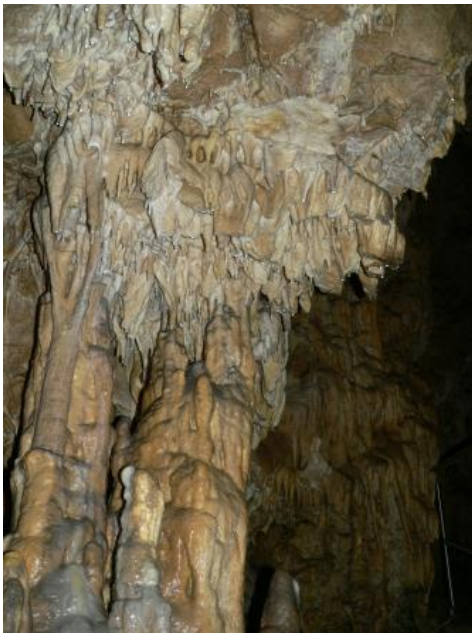
Kolbinger Höhle (Stephanshöhle), Kolbingen

Höhlen als Einstiege in die Unterwelt sind in Baden-Württemberg zahlreich zu finden und ziehen jedes Jahr viele Besucher in ihren Bann. Als typische Karsterscheinungen sind sie durch Kalklösung entstanden und in Baden-Württemberg deshalb im Wesentlichen auf das Verbreitungsgebiet von Muschelkalk und Oberjura beschränkt. Besonderheiten stellen die Olgahöhle in Honau und die Zwiefaltendorfer Tropfsteinhöhle als geologisch junge Tuffhöhlen in mächtigen Sinterterrassen dar. Andere Gesteine, wie beispielsweise im Buntsandstein oder Stubensandstein, neigen nur selten zur Höhlenbildung. Im Gegensatz zu den Karsthöhlen handelt es sich in den Sandsteinen meist um relativ kleine Objekte wie Hohlkehlen nach Unterspülungen, Blockhöhlen als Zwischenräume oft großer Blockhalden oder um Verwitterung weicher Sandsteinhorizonte.