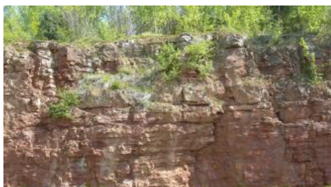
Erzlager der Murchisonaeolith-Formation (Ausschnitt) am Kahlenberg bei Ringsheim

Im Gelände sind noch häufig Spuren der alten Abbaue erkennbar: Pingen, Stollenmundlöcher, Halden und Ruinen von Förderanlagen – viele sind durch Wanderwege und entlang von Lehrpfaden erreichbar.