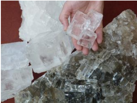
Steinsalz aus dem Steinsalzbergwerk Heilbronn

Steinsalz, früher in mehreren Bergwerken und Solen gewonnen, wird bergmännisch heute nur noch bei Heilbronn und in Haigerloch-Stetten gewonnen. Der Kalisalzabbau im Oberrheingraben ist auf deutscher Seite inzwischen ebenfalls erloschen. Das letzte Bergwerk in Buggingen schloss 1973 seine Pforten.