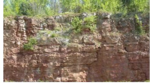
Erzlager der Murchisonaeolith-Formation (Ausschnitt) am Kahlenberg bei Ringsheim

Der Eisenerzbergbau („Doggererze“) in Wasseralfingen und Aalen begründete mit den angeschlossenen Aufbereitungsanlagen der Schwäbischen Hüttenwerke eine erste Großindustrie in Ost-Württemberg. Der Bergbau ist hier seit 1948 auflässig. Gleichartige Erze wurden bis 1942 bei Blumberg abgebaut.