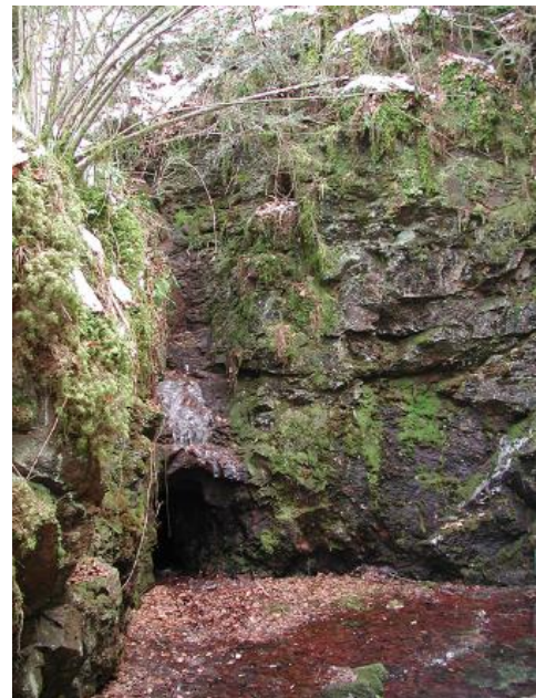
Mittelalterliche Bergbauspure bei Ehrenkirchen südlich von Freiburg

Die wichtigsten Bergbaureviere lagen im Schwarzwald. War es hier zur Römerzeit und im frühen Mittelalter vor allem die Suche nach Kupfer-, Blei- und Kobalterzen, verlagerte sich das Ziel der Abbaue anschließend zu silberhaltigen Blei- und Fahlerzen. In der Neuzeit waren vor allem Schwer- und Flussspat für die chemische Industrie gesuchte Minerale. Die Konkurrenz aus dem Ausland führte allerdings zur Schließung vieler Gruben. Heute werden nur noch in der Grube Clara bei Oberwolfach Schwerspat und Flussspat abgebaut.