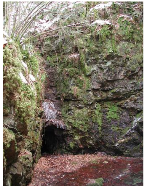
Mittelalterliche Bergbaus Spuren bei Ehrenkirchen südlich von Freiburg

Die wichtigsten Bergbaureviere lagen im Schwarzwald. War es hier zur Römerzeit und im frühen Mittelalter vor allem die Suche nach Kupfer-, Blei- und Kobalterzen, verlagerte sich das Ziel der Abbaue anschließend zu silberhaltigen Blei- und Fahlerzen. In der Neuzeit waren vor allem Schwer- und Flussspat für die chemische Industrie gesuchte Minerale. Die Konkurrenz aus dem Ausland führte allerdings zur Schließung vieler Gruben. Heute werden nur noch in der Grube Clara bei Oberwolfach Schwespat und Flussspat abgebaut.