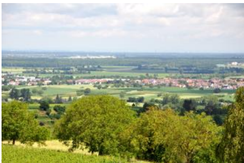
Vom Heubergturm bei Ettenheim blickt man über Mahlberg-Orschweier nach Norden in die Offenburger Rheinebene

Im Oberrheingebiet sind es v. a. die Erhebungen der Vorbergzone sowie die Vulkanruine des Kaiserstuhls, die schöne Aussichten auf die Oberrheinebene, den angrenzenden Schwarzwald und die Vogesen bieten. Vom Dinkelberg lässt sich über das Hochrheintal bis zu den Alpen blicken. An mehreren Stellen bieten Aussichtstürme eine weite Rundumsicht.