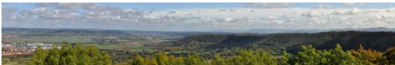
Aussicht von der Weilerburg auf das Neckartal und das Keuperbergland östlich von Rottenburg a. N.

An dieser Stelle sollen nach und nach einige Aussichtstürme und sonstige besondere Aussichtspunkte im Keuperbergland vorgestellt werden. Dazu werden kurze Erklärungen zu Landschaft und Geologie sowie Verlinkungen zu den weiterreichenden fachlichen Inhalten in LGRBwissen angeboten.