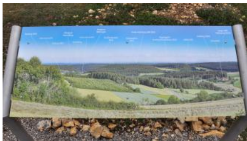
Orientierungstafel auf dem Kapf bei Egenhausen

Die höchsten Punkte der Gäulandschaften befinden sich meist im Westen, am Rand der vom Oberen, im Norden z. T. auch vom Unteren Muschelkalk gebildeten Schichtstufe. Von dort hat man sowohl auf die Ostabdachungen von Schwarzwald und Odenwald, als auch nach Osten über die Schichtstufenlandschaft zum Trauf der Schwäbischen Alb einen weiten Blick. Auch am Rand der tief eingeschnittenen Täler bieten sich beeindruckende Aussichten, ebenso wie neuerdings von dem 2017 eröffneten 246 m hohen Thyssenkrupp-Testturm bei Rottweil mit der höchsten Besucherplattform Deutschlands.