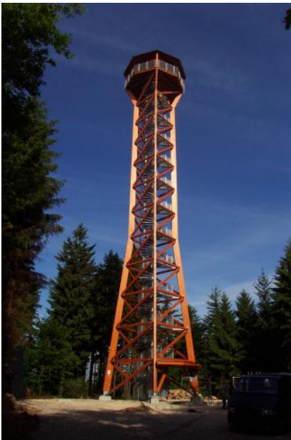
Teltschik-Turm bei Wilhelmshorn

Im Odenwald bieten sich besonders am Rand zum Oberrheingraben, aber beispielsweise auch auf dem Vulkanberg Katzenbuckel oder hoch über dem tief eingeschnittenen Neckartal interessante Aussichten.