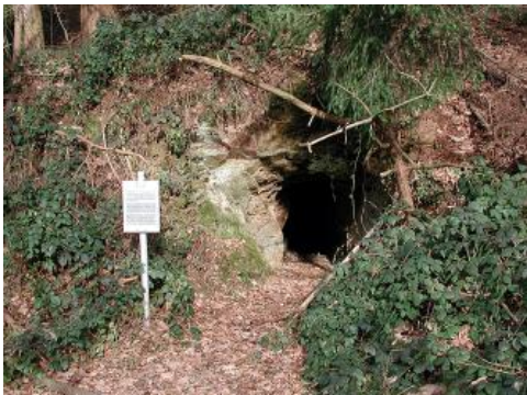
Bergbaugeschichtlicher Wanderweg in Sulzburg

In der Geotouristischen Karte sind für das Oberrhein- und Hochrheingebiet zu geowissenschaftlichen Themen derzeit drei Lehrpfade bei Badenweiler, Kandern und Sulzburg verzeichnet. Sie befinden sich alle im Übergangsbereich vom Markgräfler Hügelland zum Südschwarzwald.