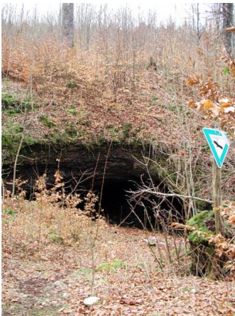
Karstkundlicher Wanderweg bei Laichingen

In der Geotouristischen Karte sind für das Gebiet der Schwäbischen Alb derzeit elf Lehrpfade zu geowissenschaftlichen Themen verzeichnet.