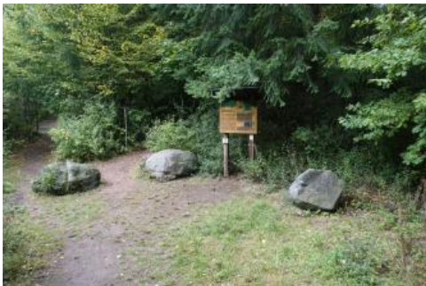
Schautafel am geologischen Lehrpfad „Weg der Kristalle“ auf dem Katzenbuckel im Odenwald

Im Odenwald und im südlichen Spessart im Norden von Baden-Württemberg sind in der Geotouristischen Karte derzeit zwei Lehrpfade zu geowissenschaftlichen Themen verzeichnet: Der Weg der Kristalle am Katzenbuckel bei Waldbrunn sowie der Geologisch-naturkundliche Wanderweg bei Kilsheim. Hinzu kommt der Geopfad am Schreckberg bei Mosbach-Diedesheim. Er liegt im Übergangsbereich von den Gäulandschaften zum Odenwald, in dem Bereich wo sich das Neckartal beginnt in den Buntsandstein einzuschneiden.