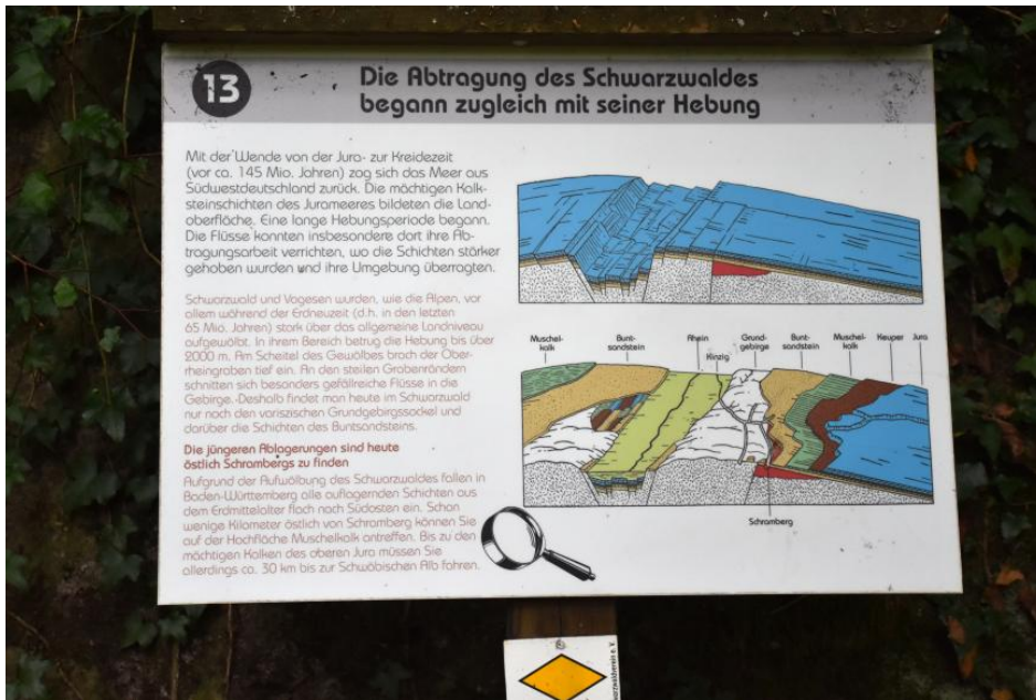
Erklärungen zur Entstehung des Schwarzwalds am Geologischen Pfad bei Schramberg