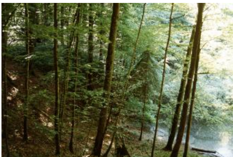
Doline Mördergrube nordöstlich von Steinheim an der Murr

Im Keuperbergland beschränken sich die Karsterscheinungen überwiegend auf den Gipskarst im Verbreitungsgebiet der Grabfeld-Formation (Gipskeuper). Dolinen und Subrosionssenken sind beispielsweise im Naturschutzgebiet Reußenberg bei Crailsheim in typischer Weise ausgebildet.