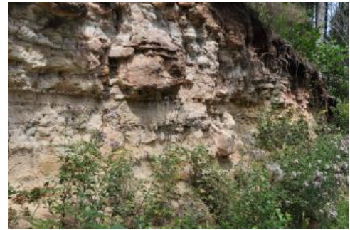
Aufschluss in der Löwenstein-Formation (Stubensandstein)