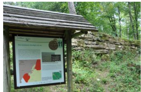
Informationstafel im ehemaligen Sandsteinbruch (Oberkeuper) auf dem Kimberg

Am Plateaurand sind schließlich die harten Sandsteine des Oberkeupers (Exter-Formation, „Rhätsandstein“) aufgeschlossen, die auch als dünne Schuttdecke den oberen Bereich der Knollenmergel-Hänge überlagern. In einem alten Steinbruch, bei dem sich auch eine Grillhütte befindet, können die gut geschichteten, feinkörnigen Quarz-Sandsteine, die früher als fast unverwüster Bau- und Pflasterstein abgebaut wurden, bestens studiert werden.