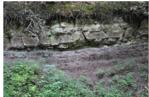
Steigerwald-Formation (Untere Bunte Mergel) und darüber liegende Bank der Hassberge-Formation (Kieselsandstein)

Ausgangspunkt ist der zwischen Bebenhausen und Tübingen unmittelbar an der L1208 gelegene Wanderparkplatz „Kirnbachtal“. Auf der mit Dinosauriern markierten, ca. 5 km langen Strecke wird an 13 Stationen die Landschaftsgeschichte erklärt und Einblick in die Gesteinsabfolgen des oberen Mittelkeupers und des Oberkeupers (Exter-Formation, „Rhät“) gegeben, die entlang des Kirnbachs und beim Anstieg zum Olgahain in mehreren Aufschlüssen studiert werden können.