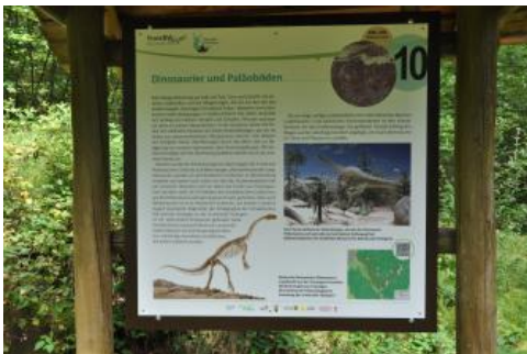
Informationstafel am Geologischen Lehrpfad im Kimbachtal

Nach einem weiteren kurzen Anstieg erhält man einen Einblick in die rötlichen Gesteine der Trossingen-Formation (Knollenmergel), die durch ihre Neigung zu Rutschungen eine typische bucklige Hangoberfläche bilden. Der mancherorts zu erkennende säbelförmige Wuchs der Bäume deutet ebenfalls darauf hin, dass der Hang in Bewegung ist. Bekannt wurde der württembergische Knollenmergel auch durch mehrere Funde von Plateosauriern. Eingelagerte weiße oder rötliche Kalkkonkretionen („Knollen“) gaben dem Knollenmergel seinen Namen. Der Anstieg führt weiter durch den Olgahain, einen ehemaligen Park der württembergischen Königin Olga, der noch an alten Sandstein-Treppen, kleinen Weihern und mächtigen alten Buchen zu erkennen ist und zu dem man ebenfalls eine Informationstafel sowie einen Gedenkstein vorfindet.