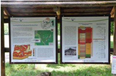
Informationstafel am Geologischen Lehrpfad im Kirnbachtal

Der Lehrpfad wurde bereits 1977 anlässlich der 500-Jahrfeier der Eberhard-Karls-Universität Tübingen vom Institut und Museum für Geologie und Paläontologie, der Naturparkverwaltung Schönbuch und den Forstbehörden angelegt. Er gehört damit zu den Ersten seiner Art im Land (Baier, 2011; Eberle & Lehr, 2015). Nachdem der Lehrpfad stark in die Jahre gekommen war, viele Tafeln zerstört und Aufschlüsse zugewachsen waren, wurde 40 Jahre später, am 2. Juni 2017 eine inhaltlich und gestalterisch erneuerte Anlage wiedereröffnet.