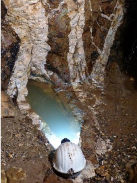
Schwerspatgang in der Grube Caroline