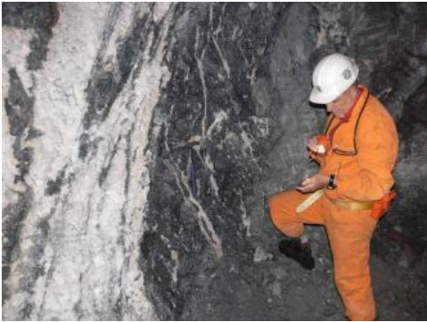
Fahlerzreicher Schwerspatgang in der Grube Clara

Gewinnung: Die Gewinnung von Baryt begann im Schwarzwald Mitte des 19. Jahrhunderts, da reinweißer Schwerspat zur Herstellung von lichtechten Farben genutzt wurde. Hauptabbaugebiete waren das Kinzigtal und das Münstertal im Südschwarzwald. Heute ist nur noch die Grube Clara in Betrieb und gewinnt Baryt und Flussspat aus überwiegend NW–SO streichenden Gangzonen . Der Abbau erfolgt mittels Sprengungen . Das gelöste Material wird mit Radladern zu Rollen und Bunkern unter Tage transportiert. Nachfolgend wird das Roherz mit LKWs vom Bergwerk zur Aufbereitung nach Wolfach gebracht. Die Weiterverarbeitung erfolgt durch Brechen, Mahlen und einer Flotation des Materials, wobei Baryt, Fluorit, silber- und kupferhaltige Erze getrennt werden.