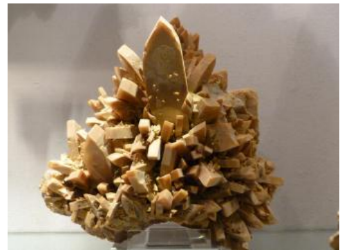
Schwerspat aus der Grube Clara

Die Kristalle des Schwerspats sind meist tafelig ausgebildet. Eine Sonderform sind keilförmige Kristalle, der sog. Meißelspat , der besonders im Kinzigtal auftritt. Zumeist sind die Kristalle aber eng mit anderen Kristallen, z. B. Flussspat, Quarz oder mit Metallerzen, zu einem dichten Mineralgemenge verwachsen. Auf der Grube Clara im Schwarzwald besteht der seit 1850 in Abbau stehende Barytgang durchschnittlich aus 70–80 % Baryt , 10–20 % Fluorit und 5–20 % Quarz sowie einigen Prozenten an anderen Mineralen und Nebengesteinseinschlüssen.