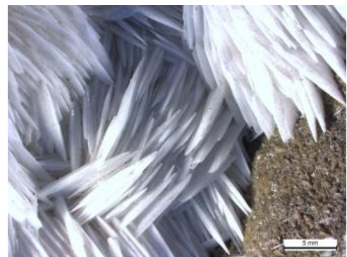
Weißer Schwerspatkristalle aus der Grube Clara

Verwendung: Der größte Teil der weltweiten Schwerspatproduktion wird als Bohrspat zur Dichteregulierung in Bohrspülungen in der Erdöl- und Erdgasindustrie verwendet. Weitere Nutzungen sind Füllstoffe und Schallschuttmatten in der Autoindustrie, Herstellung von Farben (Lithopone), Papierproduktion, chemische und Kunststoffindustrie, strahlungsabsorbierender Schwerbeton , Trinkwasserreinigung und als Kontrastmittel in der medizinischen Diagnostik.