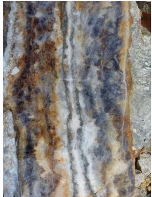
Typisches Erscheinungsbild des Finstergrund-Ganges