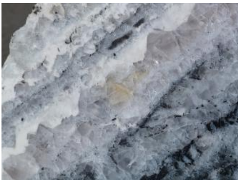
Gangstück mit klarem bis leicht violetter Flussspat

Verwendung: \text{CaF}_2 wird in der chemischen Industrie verwendet, um z. B. Flusssäure herzustellen. Weiterhin wird es zur Produktion von Kryolith ( \text{Na}_3\text{AlF}_6 ) genutzt. Bei der Aluminiumerzeugung aus Bauxit wird synthetischer Kryolith eingesetzt, da er den Schmelzpunkt herabsetzt. In der Metallurgie dient \text{CaF}_2 als Flussmittel für die Schlacke bei der Eisenverhüttung. Weitere Verwendungsbereiche liegen in der Keramik- und Glasindustrie, Schweißtechnik sowie als Pflanzenschutzmittel und Zahnpasta.