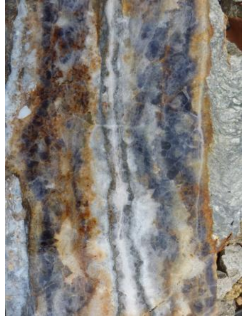
Typisches Erscheinungsbild des Finstergrund-Ganges