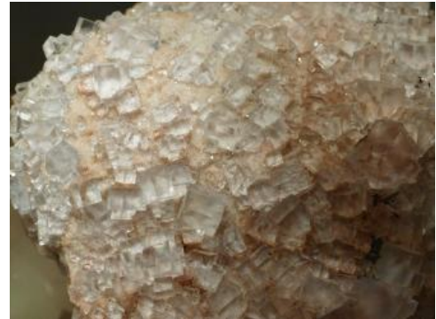
Klare Flussspatkristalle aus der Grube Clara

Gewinnung: Die Gewinnung von Flussspat begann im 20. Jahrhundert. Hauptproduzenten für Flussspat waren die Gruben im Münstertal, St. Blasien, Aitern, Grafenhausen, Igelschlatt, Brenden und Brandenburg im Südschwarzwald. Die wichtigste Gewinnungsstelle war die Grube Käfersteige südöstlich von Pforzheim, die zu den größten Ganglagerstätten Europas zählt. Bis zur Stilllegung der Grube konnte der Gang auf einer Länge von 1200 m und über mindestens 400 m Tiefenerstreckung in bauwürdiger Mächtigkeit nachgewiesen werden. Im Schwarzwald wird Flussspat nur in der Grube Clara (RG 7615-1) gewonnen. Fluor gehört zu den, hinsichtlich der Versorgungssicherheit der deutschen Industrie, als „kritisch“ eingestuften Elementen, weil die in Nutzung stehenden Fluorit-Lagerstätten zu einem großen Teil in Ländern liegen, welche den eigenen Export beschränken (z. B. China). Besonders im Schwarzwald ist aber ein großes ungenutztes Flussspatpotenzial zu erwarten.