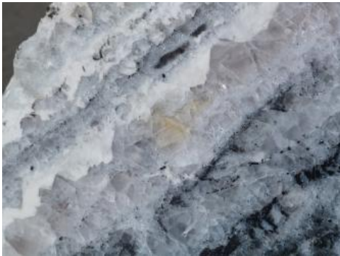
Gangstück mit klarem bis leicht violetter Flussspat

Verwendung: \text{CaF}_2 wird in der chemischen Industrie verwendet, um z. B. Flusssäure herzustellen. Weiterhin wird es zur Produktion von Kryolith ( \text{Na}_3\text{AlF}_6 ) genutzt. Bei der Aluminiumerzeugung aus Bauxit wird synthetischer Kryolith eingesetzt, da er den Schmelzpunkt herabsetzt. In der Metallurgie dient \text{CaF}_2 als Flussmittel für die Schlacke bei der Eisenverhüttung. Weitere Verwendungsbereiche liegen in der Keramik- und Glasindustrie, Schweißtechnik sowie als Pflanzenschutzmittel und Zahnpasta.