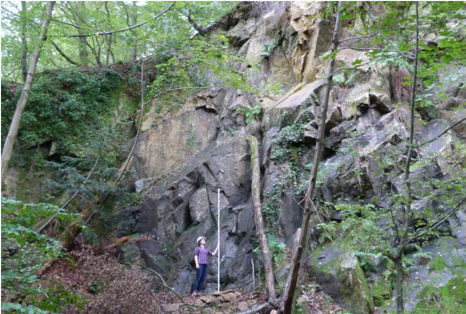
Granitporphyr im aufgelassenen Steinbruch bei Kropbach