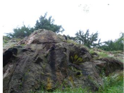
Die Granitporphyre durchschlagen als Gänge das metamorphe Grundgebirge.

Granitporphyrgang der südlich angrenzenden Badenweiler-Lenzkirch-Zone wurde auf ein Intrusionsalter von 332 Mio. Jahre datiert (Schaltegger, 2000). Nach Schleicher (1976) sind die Granitporphyrgänge im Münstertal als Produkte anatektischer Aufschmelzprozesse der den Schwarzwald unterlagernden Kruste zu sehen, welche während einer bruchtektonischen Phase ins überlagernde Grundgebirge intrudierten.