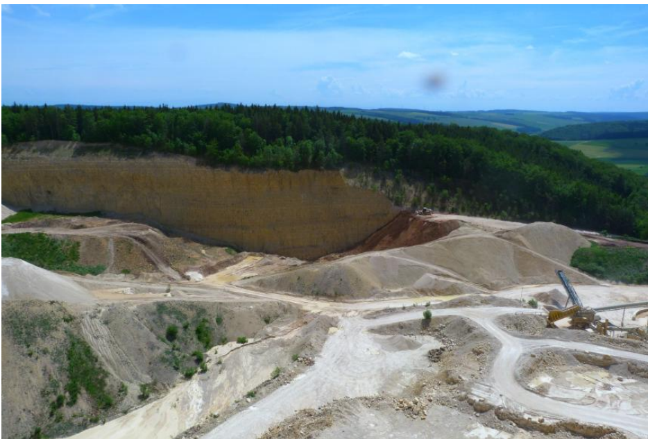
Übersicht Steinbruch Geisingen