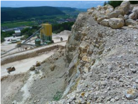
Blick über den Steinbruch Geisingen mit Förderanlage

Gewinnung: Die Gewinnung erfolgt im Trockenabbau durch Lockerungssprengungen, Reißen und Baggern. Das Haufwerk wird mit Schwerlastkraftwagen zu den Aufbereitungsanlagen im Steinbruch transportiert und durch Brechen, Sieben und z. T. Mischen zu unterschiedlichen Produkten veredelt.