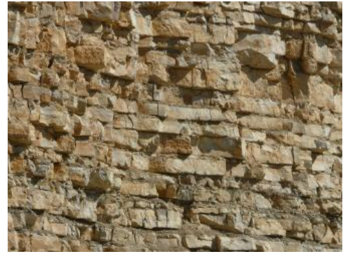
Detailaufnahme aus dem aufgelassenen Steinbruch Seitingen-Oberflacht

Chemische Zusammensetzung für die Bankkalksteine der Wohlgeschichtete-Kalke-Formation (7 Proben aus den Steinbrüchen Geisingen (RG 8018-1), Dürbheim (RG 7918-1), Deilingen (Riese, RG 7818-2), Dotternhausen (Plettenberg, RG 7718-1), dem aufgelassenen Steinbruch Albstadt-Pfeffingen (Auchtberg, RG 7719-1) und der LGRB-Rohstofferkundungsbohrung Ro7819/B3 [93,2–96,6 m]: