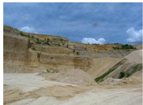
Auskeilende, dunkelgraue Lacunosamergel (joL)

Die Mächtigkeit der Wohlgeschichtete-Kalke-Formation reicht von 60–110 m und nimmt von Süden nach Norden ab. Durch eine häufig auftretende Verschwammung (Lochenfazies) kommt es im Bereich Wehingen–Ober-/Unterdigheim–Meßstetten und Ratshausen–Hausen am Tann–Tieringen sowie bei Margrethausen–Burgfelden zu erheblichen Mächtigkeitsreduzierungen innerhalb der Schichtfazies. Durch das Auftreten der Mittleren Lochen-Schichten ist dort die Mächtigkeit der Wohlgeschichtete-Kalke-Formation auf 10–60 m reduziert.