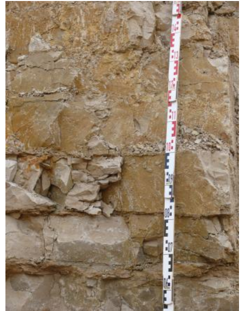
Abbauwand des Steinbruchs Geisingen

3) Wohlgeschichtete-Kalke-Formation: Die monotonen Bankkalksteine bestehen aus 10–60 cm, im Mittel 20–30 cm mächtigen, hellgraubeigen dichten Kalksteinen mit mehreren 2–10 cm mächtigen Mergelsteinzwischenlagen. Die Kalksteine weisen einen glatten bis muscheligen, untergeordnet auch rauen Bruch und eine glatte Schichtoberfläche auf. Das Verhältnis der Kalksteinbänke zu den Mergelsteinlagen beträgt etwa 10 : 1 bis 5 : 1. Die Mächtigkeit der Mergelsteinbänke sowie der Mergelsteinanteil an der Schichtenfolge (5–25 %) nehmen dabei vom Hangenden zum Liegenden (Impressamergel-Formation) deutlich zu. Der untere, 20 m mächtige Abschnitt direkt über der Impressamergel-Formation weist bereits einen Mergelsteinanteil von ca. 20–25 % auf. Häufig treten auf den Kluft- und Schichtflächen Dendriten und charakteristische rostbraune Flecken auf. Die Bankkalksteine verwittern blockig-plattig, die Mergelsteinlagen scherbzig-kleinstückig. Durch die vertikale Klüftung erinnert die Schichtenfolge an ein wohlgeschichtetes Mauerwerk.