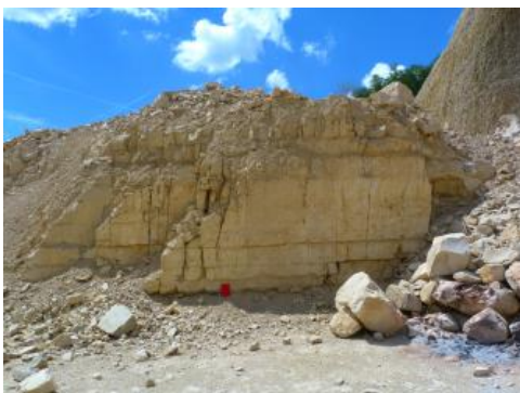
Dickbankige (1,0 m) Kalksteine an der Basis der Wohlgeschichtete-Kalke-Formation (joW)

Die zur Herstellung von Natursteinkörnungen nutzbaren Bankkalksteine des unteren Oberjuras der südwestlichen und westlichen Schwäbischen Alb bilden einen flächenhaften, schichtig aufgebauten Rohstoffkörper, der mit wenigen Grad nach Osten bis Südosten einfällt. Die Abgrenzungen der dargestellten Lagerstättenkörper sind von verschiedenen Kriterien abhängig. Dazu zählen Eintalungen, Störungszonen, Dolinen und Senken sowie das Abraum-Nutzschicht-Verhältnis. Der Abgrenzung der wirtschaftlich interessanten Lagerstättenkörper auf der KMR 50 liegen außerdem die nutzbare Mindestmächtigkeit und ein erforderlicher Mindestvorrat von 10 Mio. t zugrunde.