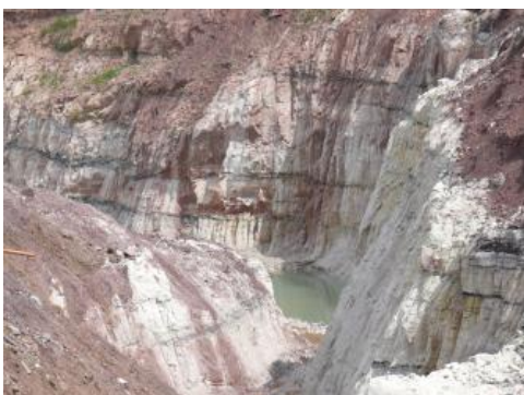
Sandsteine im Steinbruch Berglen-Höblinswart

Die Sedimente der Löwenstein-Formation (Stubensandstein-Schichten) bilden einen schichtförmig aufgebauten Gesteinskörper, der sich westlich und nördlich der Schwäbischen Alb erstreckt und große Teile des Keuperberglandes einnimmt. Er fällt mit wenigen Grad nach Süden bis Südosten ein und besteht aus einer Wechselfolge von Sandsteinen und Tonsteinen. Die Gesteine bildeten sich in einem weit verzweigten Flusssystem , in dem die Sandsteine die Rinnenfüllungen und die Tonsteine die Ablagerungen der Überflutungsebene repräsentieren. Die stetige Verlagerung der Flussrinnen bedingte sowohl horizontal als auch vertikal einen raschen Wechsel von Sand- und Tonsteinen . Die verwitterten Partien werden als Mürbsandsteine bezeichnet.